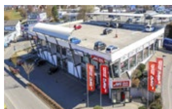
Zimmern ob Rottweil