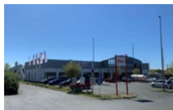
Bamberg - RingCenter